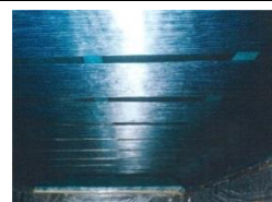
連続繊維シート貼付け工 (⑤)