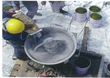
エポキシグラウトの混合(アルファテック800)