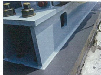
エポキシグラウト打設完了(本体側)