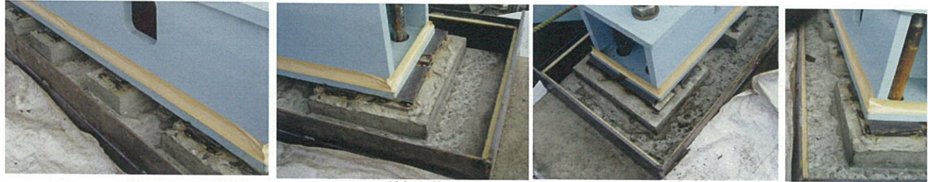
鉄板型枠の設置・シール