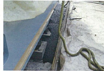
エポキシグラウト打設(アルファテック800)