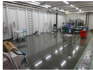
アルファテック 150 硬化後