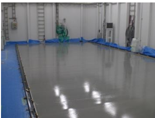
下地処理の上 AT340 塗布後 AT830H 打設