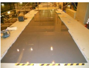
アルファテック 150 打設後