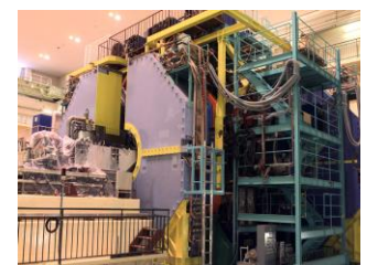
電子ビーム衝突点「BELL II 測定器」