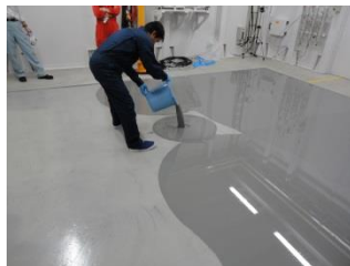
アルファテック 150 打設