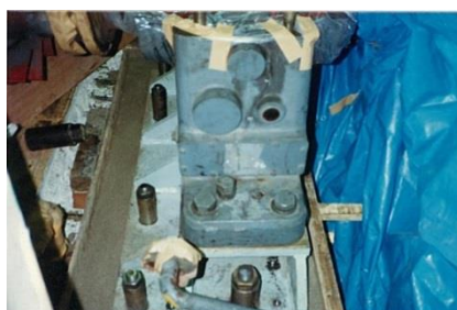
レベル調査後のエポキシグラウト (アルファテック 800) 充填