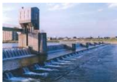
可動堰水たたき床版