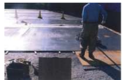
可動堰水たたき床版