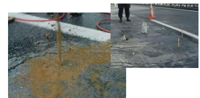
④床版洗浄 (左: 泥土水流出、右: 清水流出)